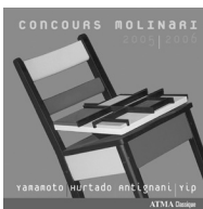
CONCOURS MOLINARI 2001-2006 ACD2 2286 / 2323 / 2368