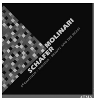
R. MURRAY SCHAFER 8 e Quatuor à cordes Theseus Beauty and the Beast ACD2 2201