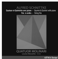
ALFRED SCHNITTKE Quatuor et Quintette avec piano Trio à cordes ACD2 2669