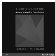
ALFRED SCHNITTKE Quatuors à cordes ACD2 2634