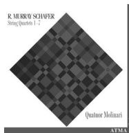
R. MURRAY SCHAFER String Quartets 1-7 ACD2 2188-89